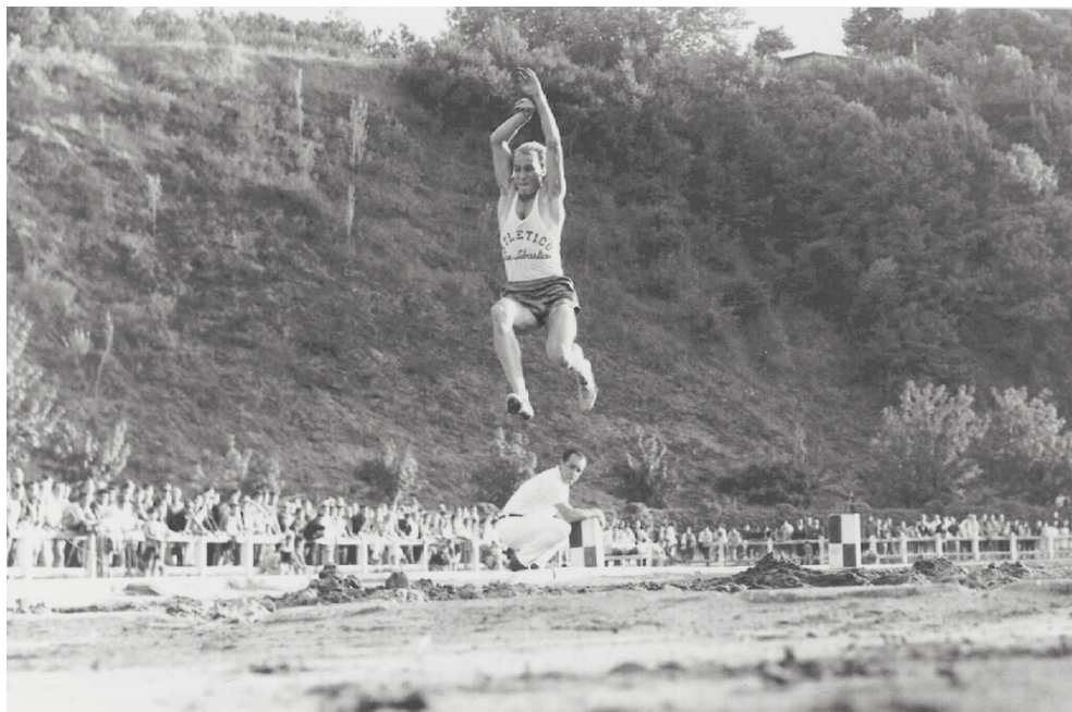
Saltando en su querida pista de Anoeta en San Sebastián con su equipación de casi toda una vida, la del At. San Sebastián.