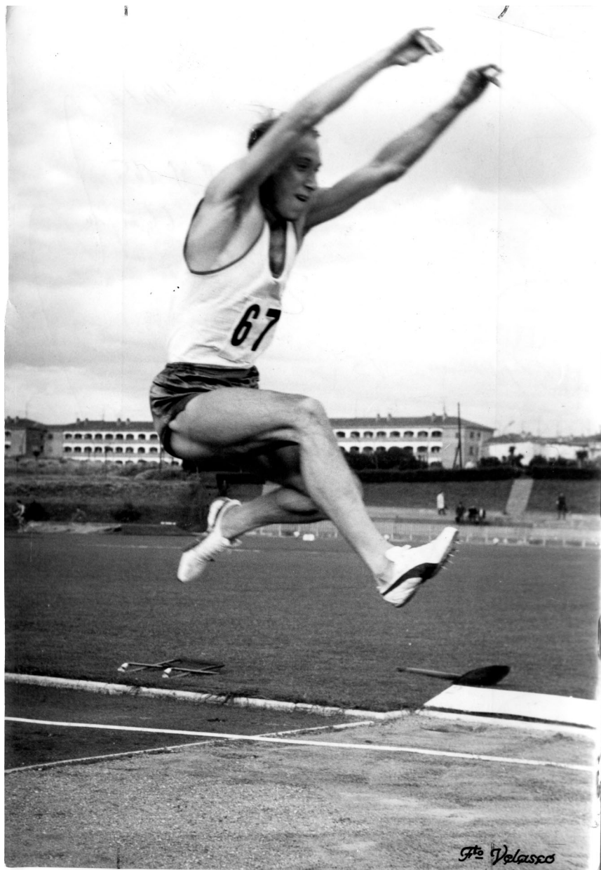
Areta saltando en la pista de la Ciudad Deportiva del Real Madrid.