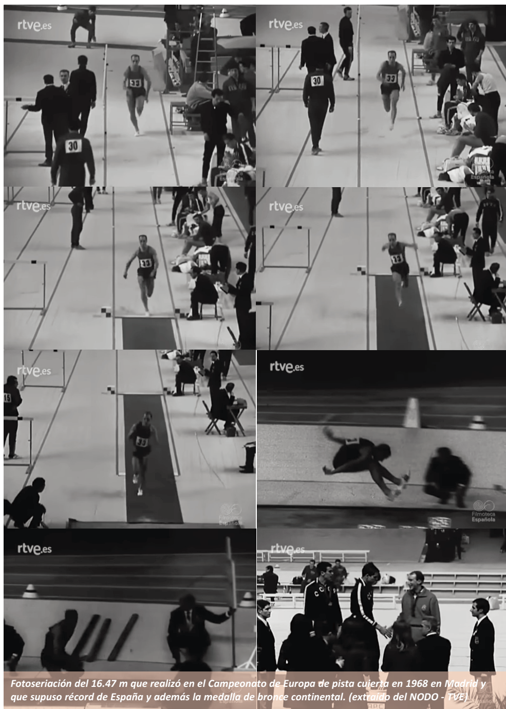
Fotoseriación del 16.47 m que realizó en el Campeonato de Europa de pista cubierta en 1968 en Madrid y que supuso récord de España y además la medalla de bronce continental.